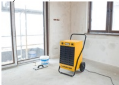
Строительные площадки со сложными условиями работы